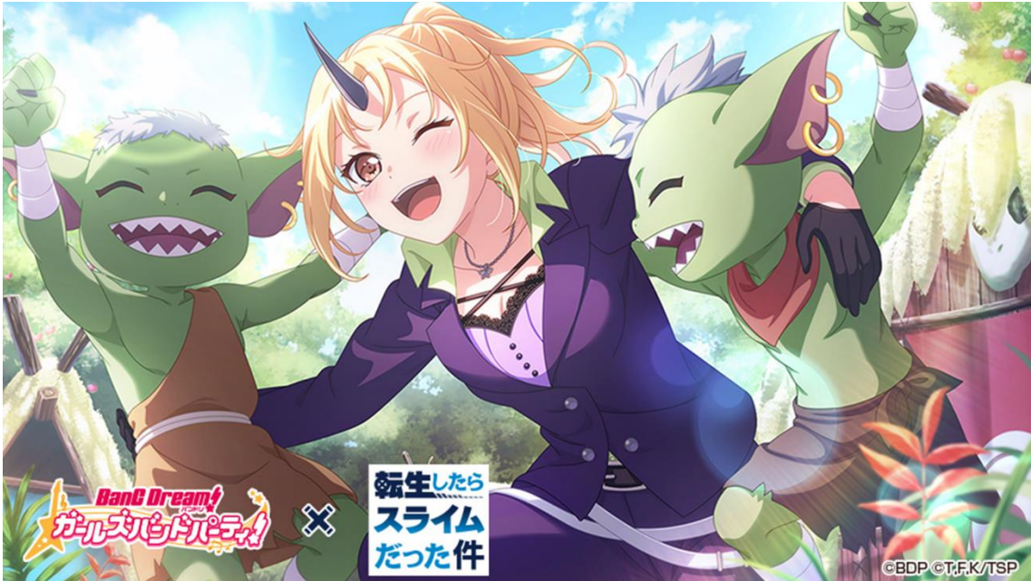
★3 桐ヶ谷透子 (特訓前)