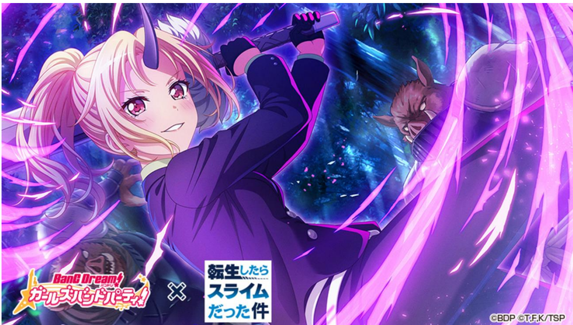
★3 桐ヶ谷透子 (特訓後)