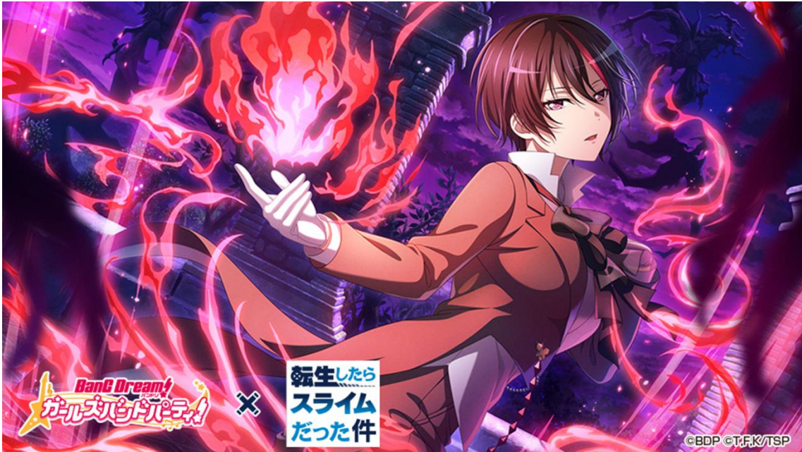
★3 八潮瑠唯 (特訓後)