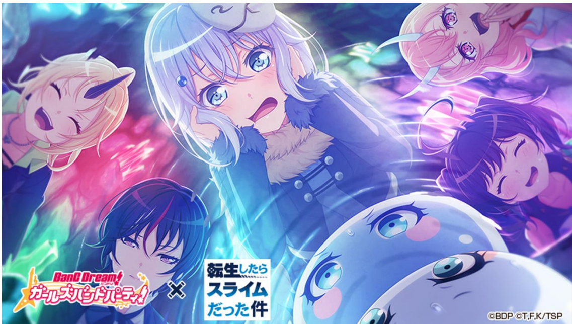
★5 倉田ましろ (特訓前)