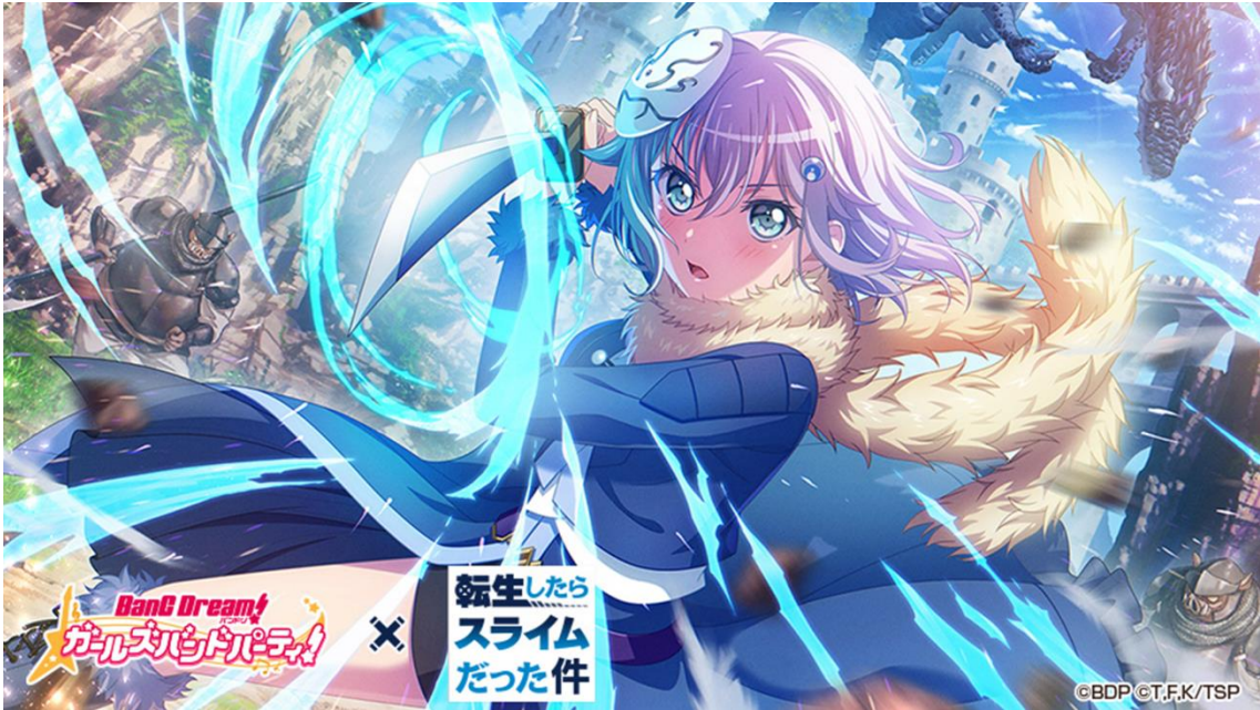
★5 倉田ましろ (特訓後)