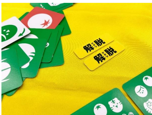
▲勝者がもらえる解脱チップ