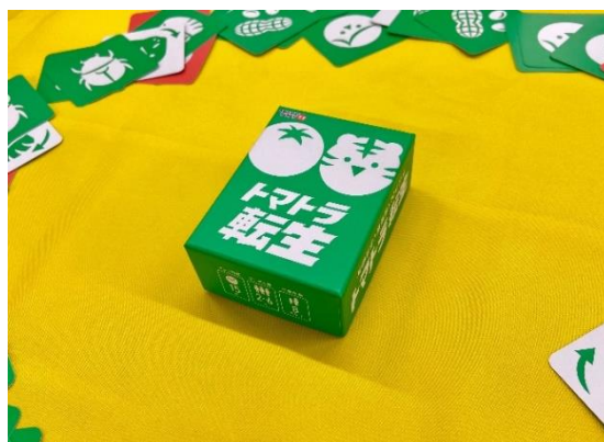
▲かわいいパッケージデザイン