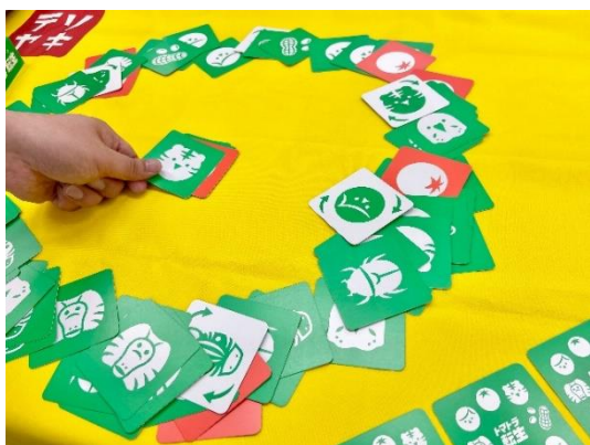
▲スピード勝負で場か手札からカードを出す