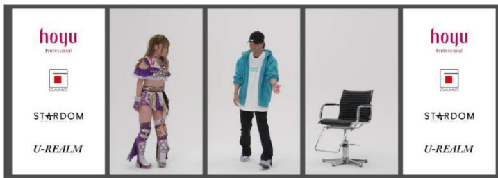
▲サイネージ5面パネルCM配信イメージ