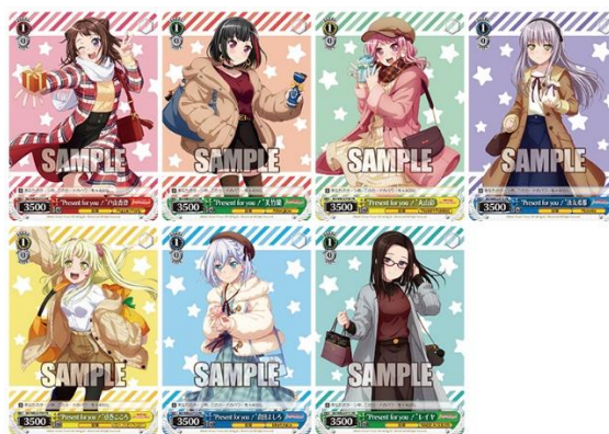
▲ヴァイスシュヴァルツ PR カード (全 7 種)

★フェア開催に合わせて、ガルパコラボの Cratte (グラッテ) やアニメイトポイント景品の交換も開始!★