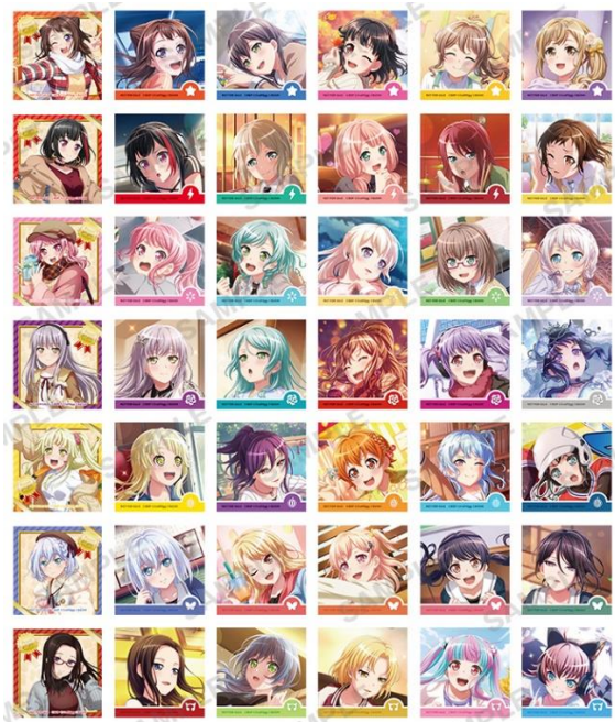
▲キラキラステッカー (全 42 種)

・ 期間中、開催店舗にて『BanG Dream!』関連のキャラクターグッズ、書籍(月刊ブシロード含む)、グラッテ商品をご購入・ご予約 1,000 円(税込)毎、または、CD・DVD・Blu-ray(2020年11月以前に発売された旧譜のみ)をご購入 1 本毎に、特典キラキラステッカー(全 42 種)とヴァイスシュヴァルツ PR カード(全 7 種)を、それぞれランダムで 1 枚ずつプレゼント!(数量限定なので、無くなり次第終了となります。)