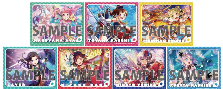
▲サテステッカー (全7種) 各100P