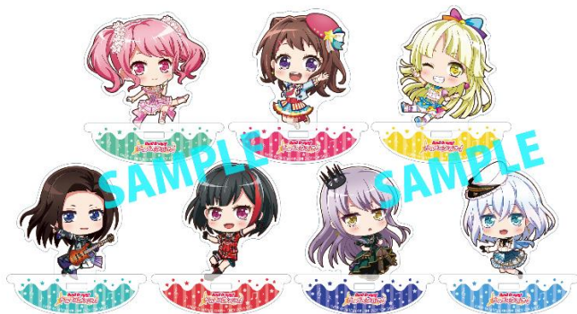
▲ころりんアクリルスタンド (全7種) 各500P