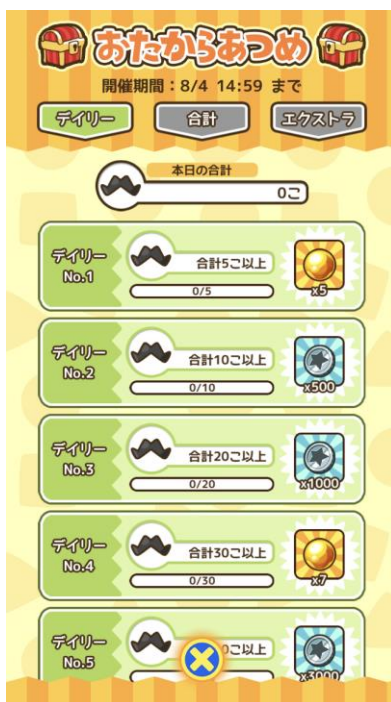
▲おたからあつめ・デイリーお題