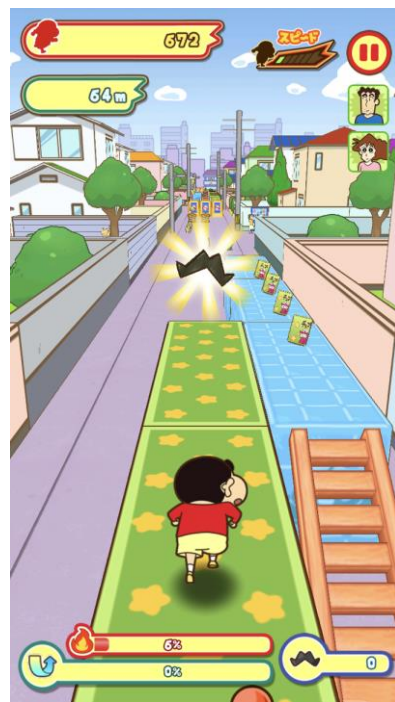
▲おたからあつめ・ラン画面イメージ