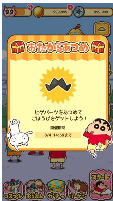
▲イベント「おたからあつめ」開始画面