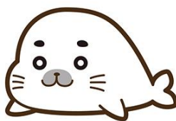
▲おうえんおとも「ゴマちゃん」