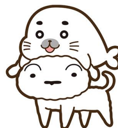
▲おうえんおとも「ゴマちゃんシロ」