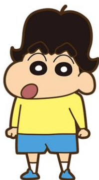
▲コスプレ「アシベしんちゃん」