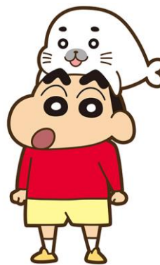
▲コスプレ「ゴマちゃんしんちゃん」