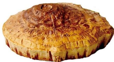
▽ダイヤモンドヘッド